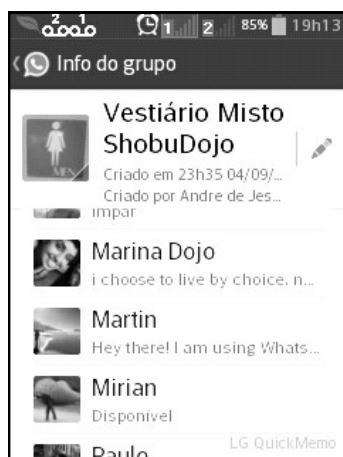
Grupo renomeado com a inclusão das garotas.

O que era o Clube do Bolinha mudou, agora,